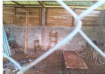
Foto 6: El techo de la cocina muestra el deterioro y su estructura

Observación: Si es necesario se pueden agregar hojas adicionales y actualizar el número de hojas.