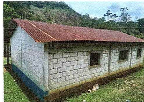
Foto 4: La estructura del establecimiento requiere mantenimiento en sus paredes y en su estructura de techo