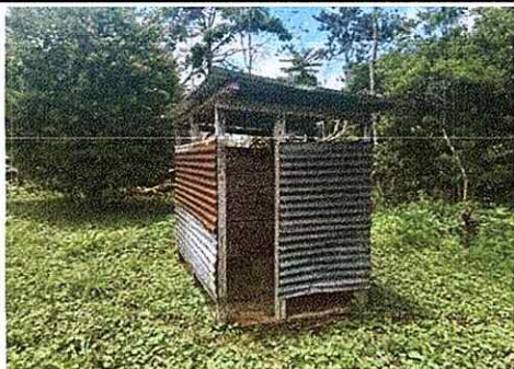
Foto 5: Para el funcionamiento de los baños requiere mantenimiento en estructura