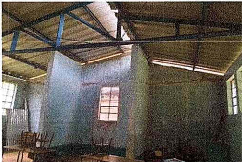
Foto 3: El techo del establecimiento tiene filtracion de agua por lo tanto requiere cambio